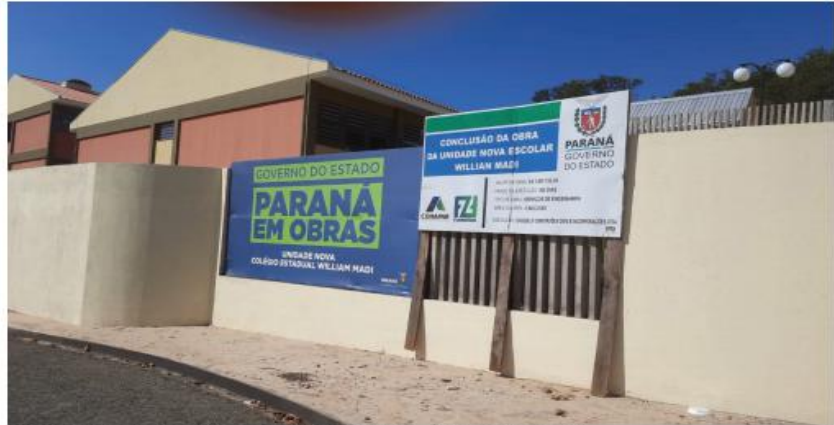
Em todo o Paraná, o Estado investiu cerca de R$ 60 milhões em obras de infraestrutura escolar

No NRE de Jacarezinho, dois colégios receberam investimentos. Em Cambará, foram