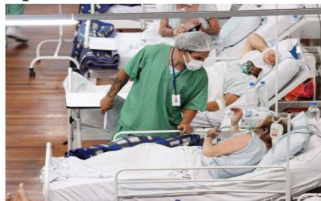
Pacientes com outras doenças precisarão de atendimento o mais breve possível, o que poderá sobrecarregar a rede hospitalar tal cenário", revela.