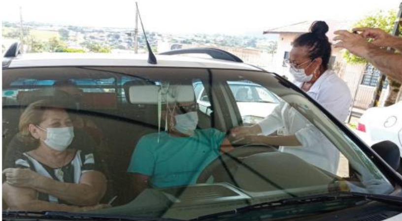
A transição por meio de doação, acontecerá até junho do presente ano Da Redação

Foram 44.779 aplicações referentes à primeira dose, o equivalente a 15% da população regional, e outras 22.468 segundas doses