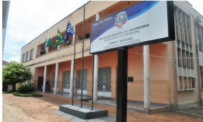
Prefeitura regulamentou aplicação de multas para desrespeitos às medidas de combate à Covid-19

Decreto municipal prevê multas de R$ 250 a R$ 2 mil, dependendo da infração