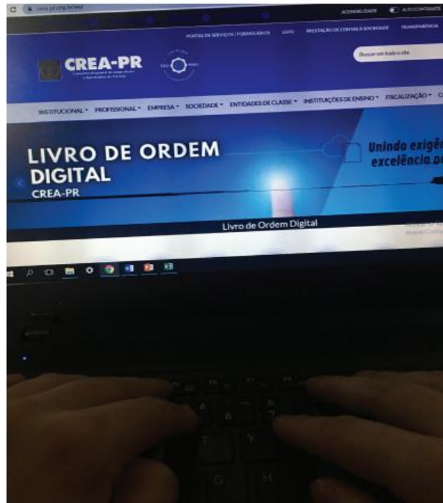
Sistema está sendo preparado para emitir alertas aos profissionais, quando forem emitir ARTs

Em dúvida, os profissionais podem obter mais informações pelo telefone 0800 041 0067 e também no site do Crea-PR ( www.crea-pr.org.br/ws/livro-de-ordem ).