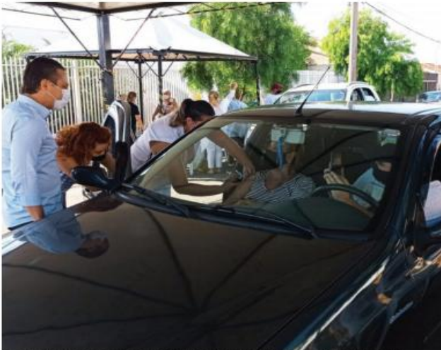
Se for levada em conta apenas a primeira dose, Jacarezinho já aplicou mais de 7 mil vacinas

Com a nova remessa de imunizantes contra a Covid-19 recebida por prefeituras locais no fim de semana, a região chegou ao total de 67.247 doses aplicadas, de acordo com dados do vacinômetro do governo do Estado. O número diz respeito aos 22 municípios que estão na área de atuação da 19ª Regional de Saúde, sediada em Jacarezinho. Deste total, foram 44.779 primeiras doses aplicadas pelas secretarias municipais de Saúde para públicos com idades superiores aos 62 anos. Isto significa que 15% da população total destes 22 municípios (289.587 moradores) recebeu a dose inicial da vacina. Já a segunda dose foi recebida por 22.468 moradores da região, que após alguns dias a aplicação, terão completado o processo de imunização contra a Covid-19, o que acontece de duas a três semanas após a dose final. Percentualmente, são 7,7% da população regional devidamente vacinada. Os números apresentam crescimento com relação a semana passada. Até a tarde de sexta-feira (23) os 22 municípios da micro região apresentavam o total de 42.205 primeiras doses aplicadas e outras 17.655 segundas doses aplicadas.