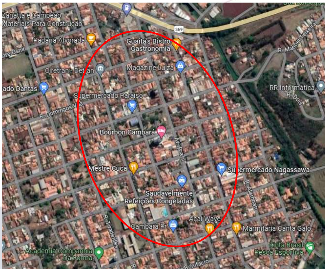
Figura 1: Macrorregião analisada

A região utilizada para o estudo, juntamente com as considerações nos itens anteriores, pode ser visualizada na Figura 01.