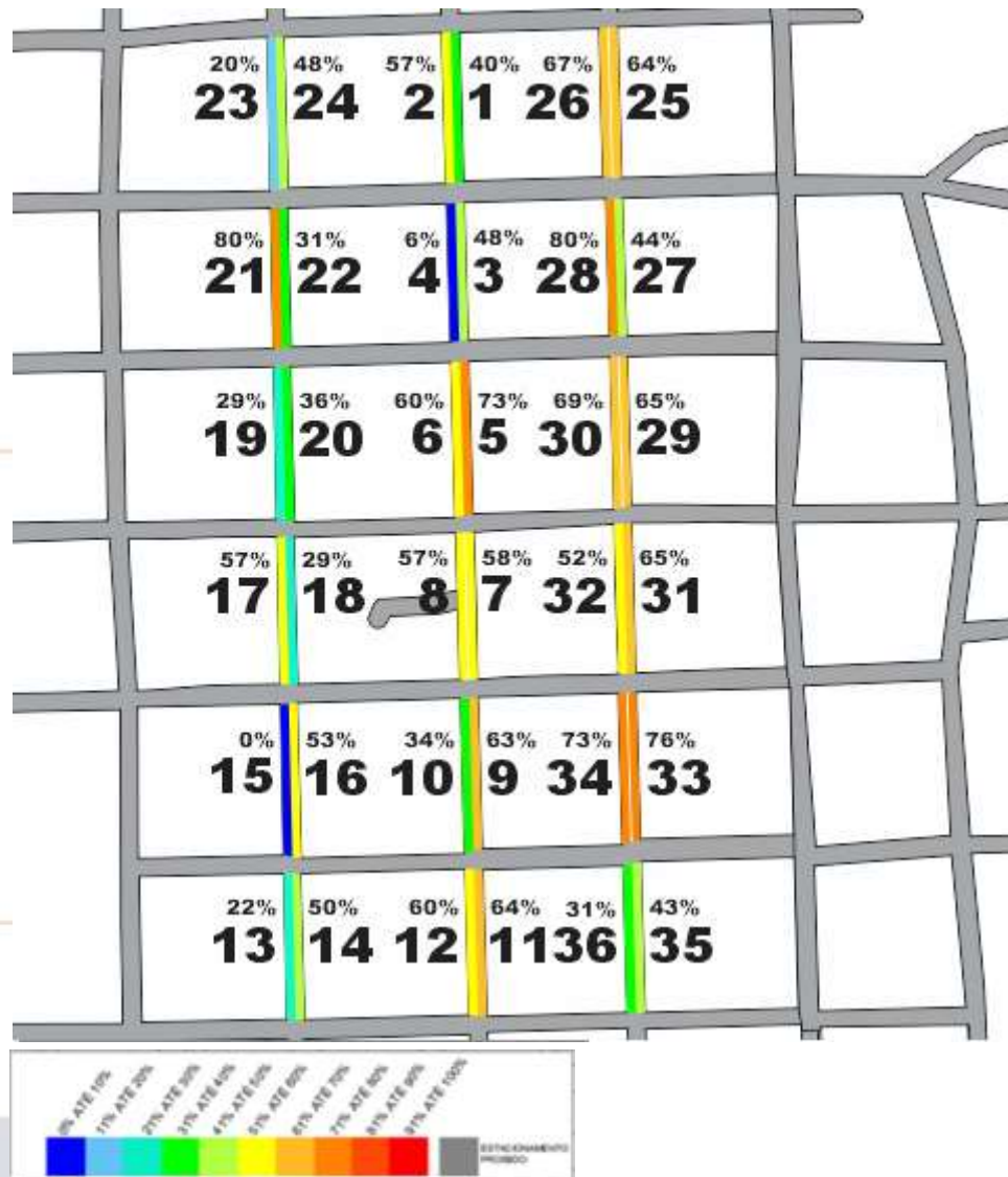
Figura 3: Percentual de Permanência dos veículos - Período Matutino