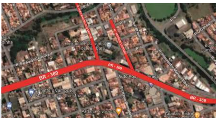
Figura 1 – Localização das Principais vias de acesso ao Terminal Rodoviário

O acesso ao terminal não possui sinalização horizontal, no entanto o pavimento encontra-se me geral em boa situação.