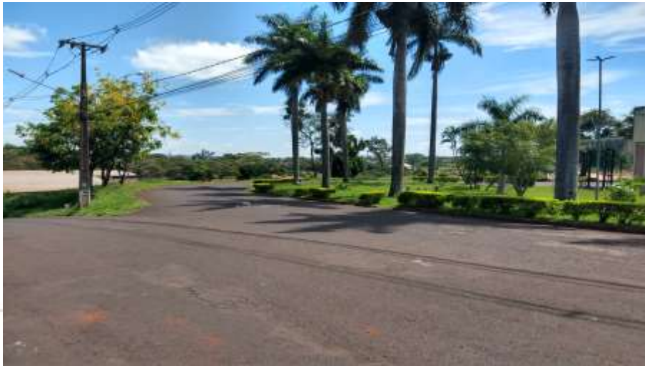
Figura 3 – Detalhamento acesso R. José Manuel dos Santos