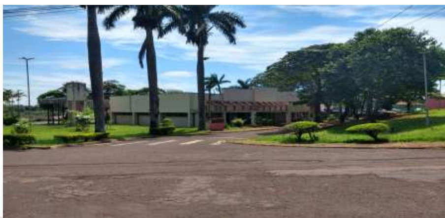
Figura 5 – Via de embarque e desembarque