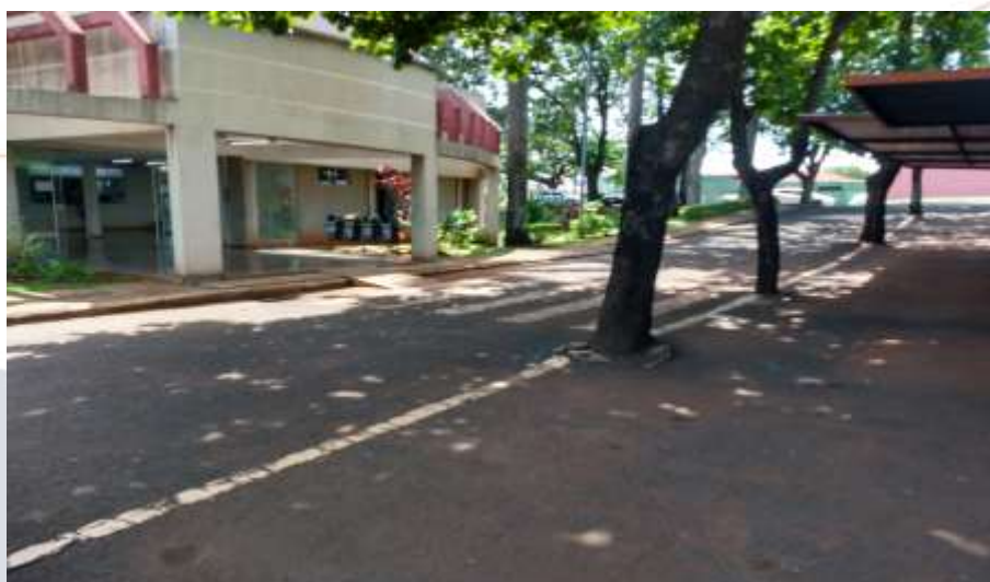
Figura 8 – Acessibilidade ao terminal rodoviário

O acesso a rodoviária possui acessibilidade nas áreas de embarque e desembarque, porém, as calçadas em frente a mesma, não se encontram em condições satisfatórias não possuindo acessibilidade a mesma.