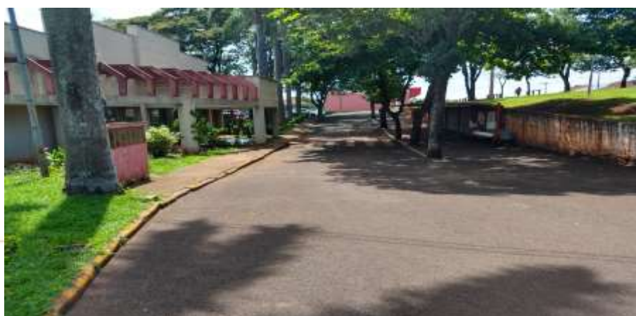
Figura 6 - Zona de frenagem – Acesso a rodoviária