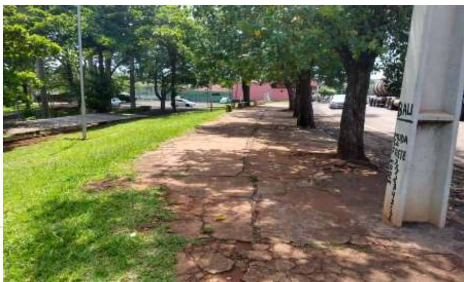
Figura 10 – Falta de rampa de acessibilidade a calçada em frente a rodoviária