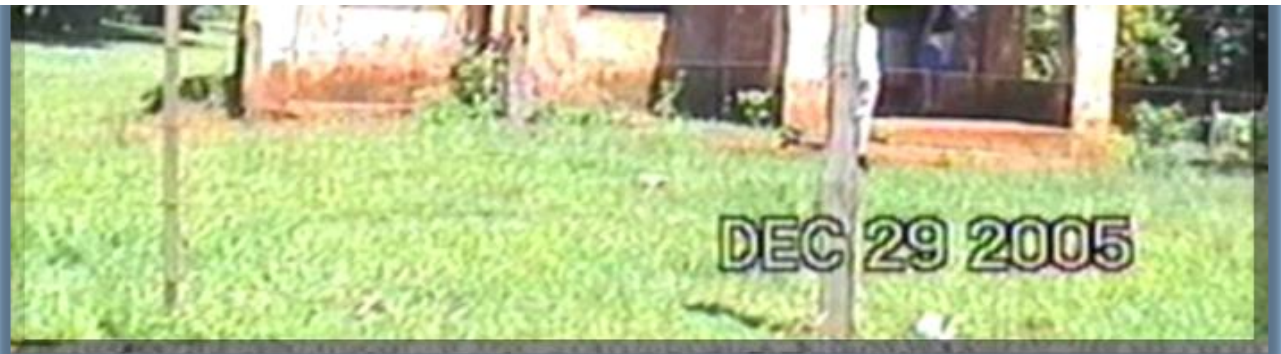
LOCALIZAÇÃO DA ESCOLA NO MUNICÍPIO