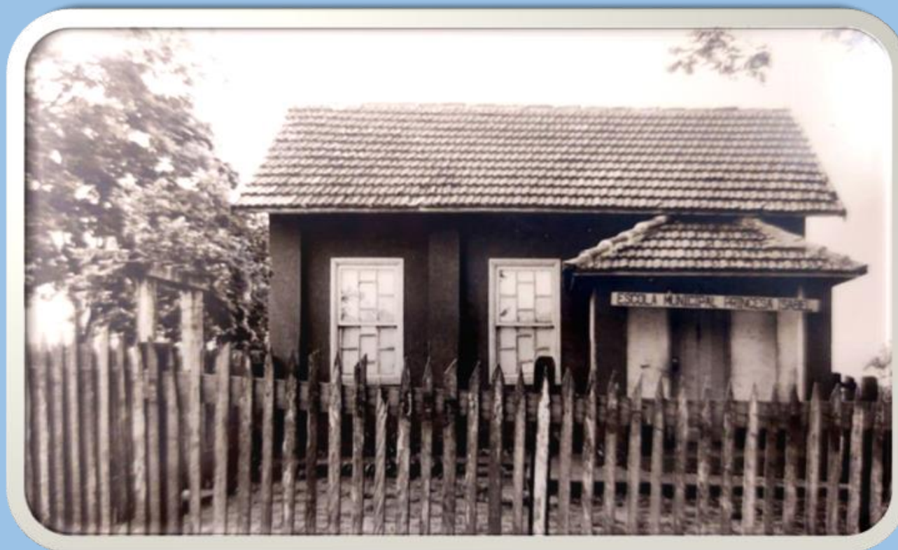
FOTO DA ESCOLA EM ABRIL DE 1980