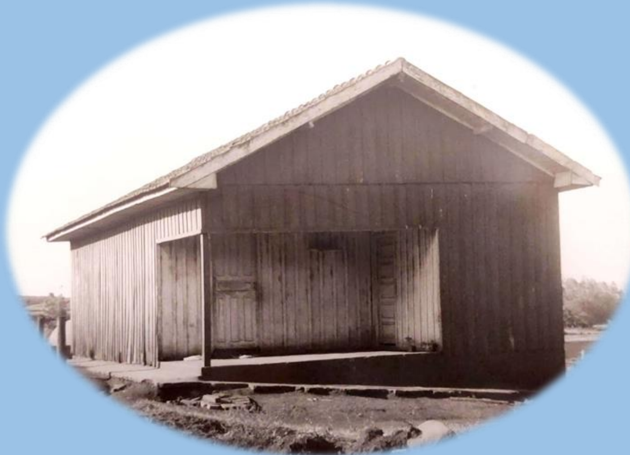
FOTO DA ESCOLA EM ABRIL DE 1980