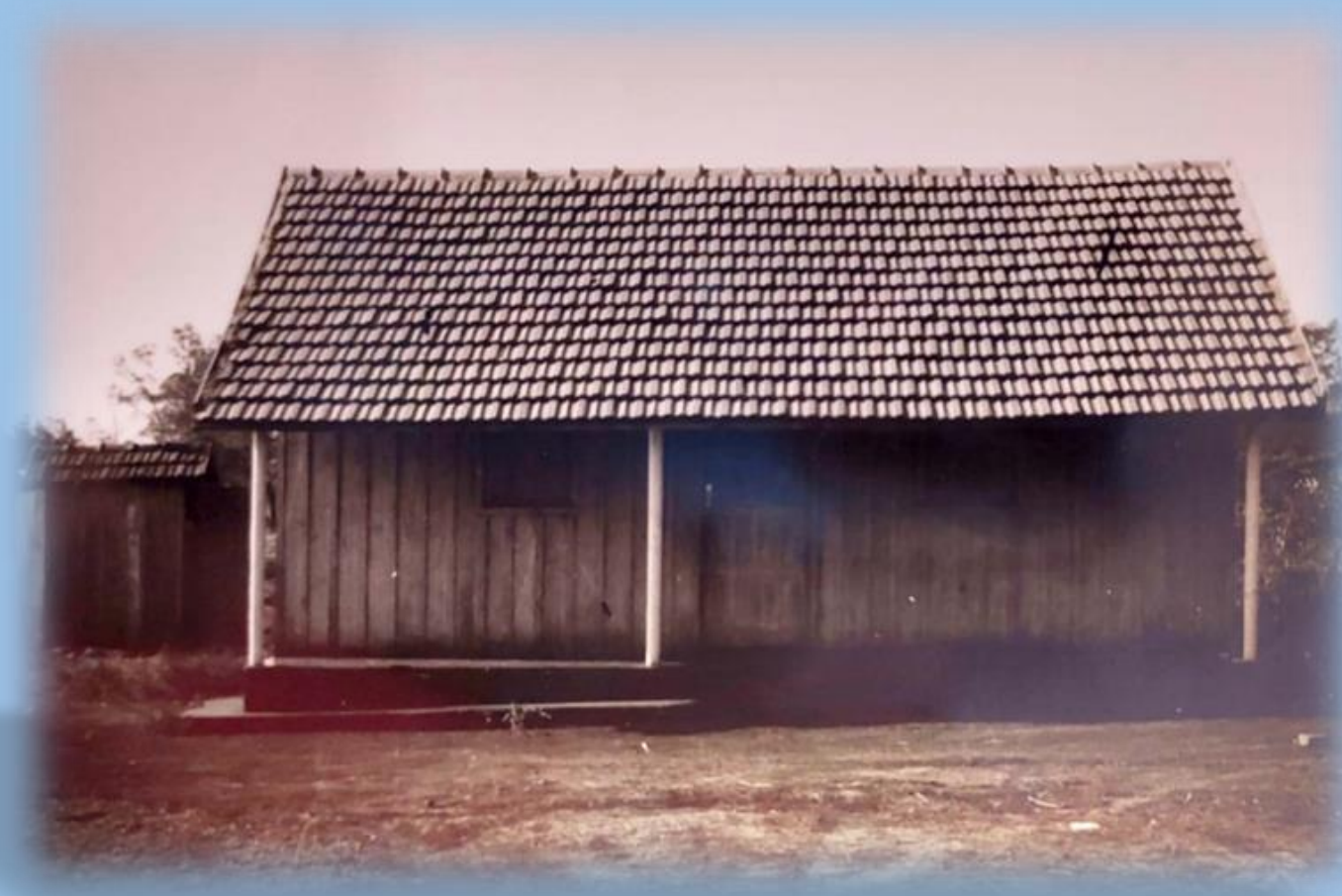
FOTO DA ESCOLA EM 1954