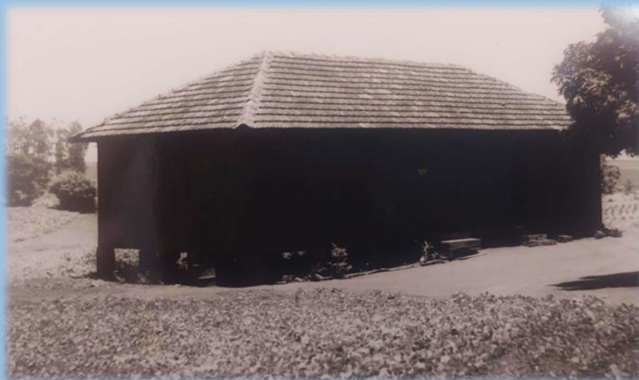
LOCALIZAÇÃO DA ESCOLA NO MUNICÍPIO