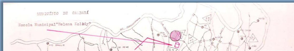
LOCALIZAÇÃO DA ESCOLA NO MUNICÍPIO