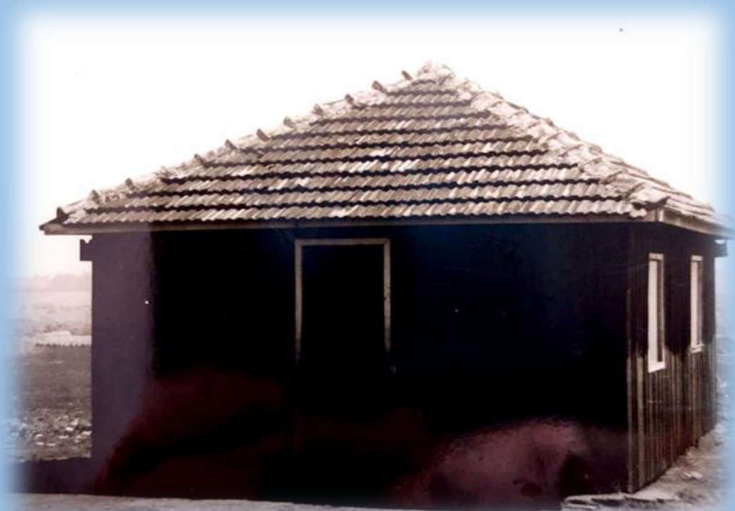
FOTO DA ESCOLA EM ABRIL DE 1980

TEVE INICIO EM 1966. ENCONTRAM-SE EM NOSSOS REGISTROS 514 ALUNOS MATRICULADOS NA ESCOLA ATÉ FINAL DOS ANOS 1980