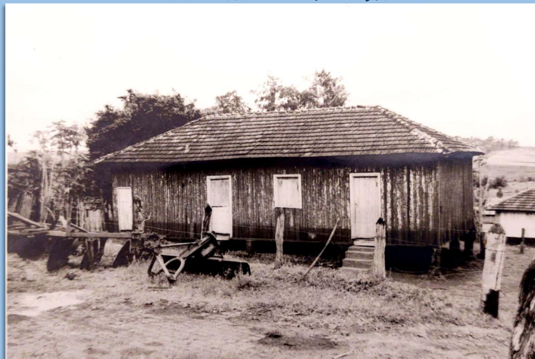
FOTO DA ESCOLA EM ABRIL DE 1980